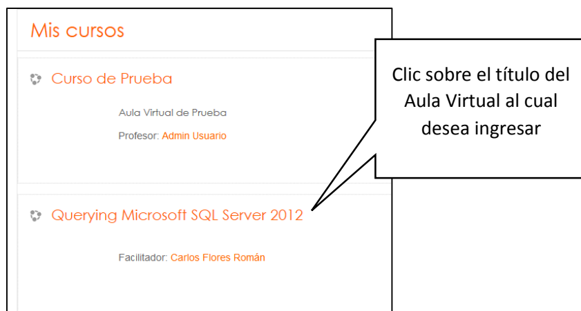
Ilustración 3: Área de Mis Cursos en Moodle