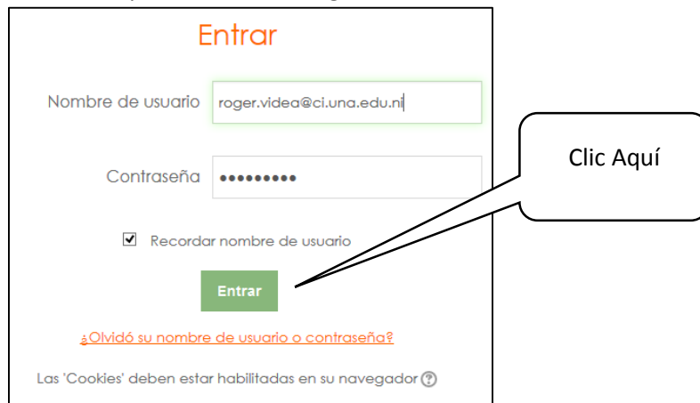
Ilustración 2: Ingresar datos del usuario